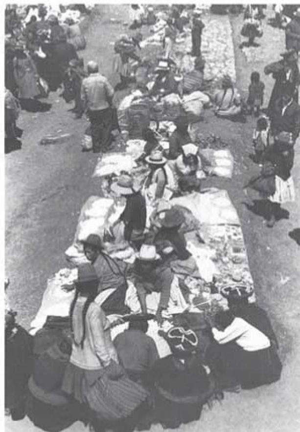
Indianmarknaden i Chunchero, Peru.

Den vite mannen och hans husdjur hade ännu en gång rubbat den biologiska jämvikten i ett känsligt