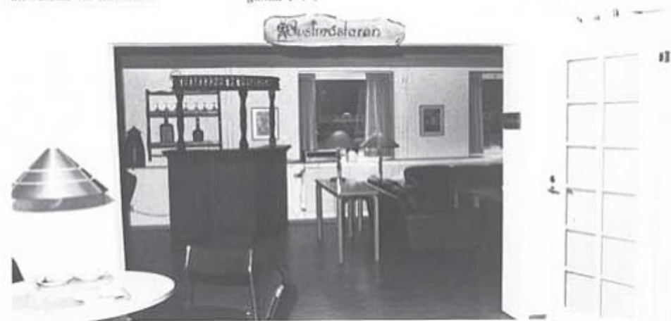
Nedervåningen, i källarplanet rymmer bl a rökavdelning, bar och TV-del. Skytten Rustmästaren, medförd från tidigare mässen för plutonsofficerare vid "gamla T 4".