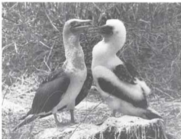
Blåfotad sula – en gammal och en äldre fågel.