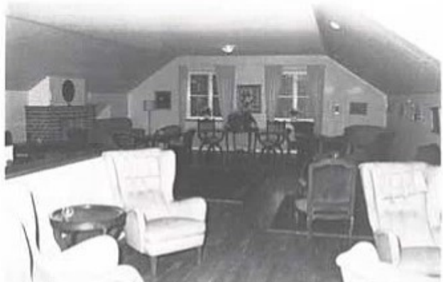
Övre planet, stora salongen, ljus och öppet i dämpade toner. Medaljong och platta över spisen erinrade om tiden då byggnaden var mäss för P 2 kompaniofficerare.

Benämningarna regements-, kompani-, och plutonsofficer upphörde att gälla fr o m 1983-06-01 och alla befälskategorierna fick benämningen yrkesofficer. I det gamla befälssystemet fanns tre kåter med vardera en mäss för både sällskaplig och facklig gemenskap. Detta ansågs nu med det nya systemet inte vara funktionellt utan i årsskiftet 1983/84 bildades Officerersällskapet.