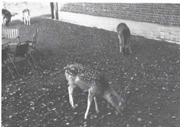
Den trevliga utsikten från mitt fönster, som snart skall bytas mot Stockholms centralare delar.

sta med T 4 och Kamratföreningen gör det ännu trevligare att besöka.