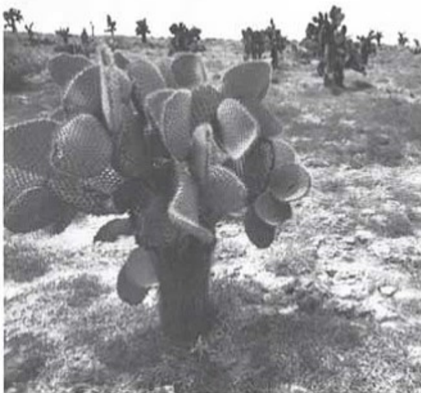
Opuntia kaktusar på ön Plata Island (Bava pagos).

Under en resa lämnar man sitt inrutade vardagsliv för ett tag. Synintrycken blir annorlunda och upplevelserna staplas på varandra. Dessa i sin tur skapar minnen och det är på minnena man bygger upp sina egna värderingar. Att resa är således att få perspektiv på sin egen tillvaro. Nog så viktigt när man skall tolka information från olika delar av vår värld. Hur lätt är det inte annars att mäta det mesta med "svenska mått"!