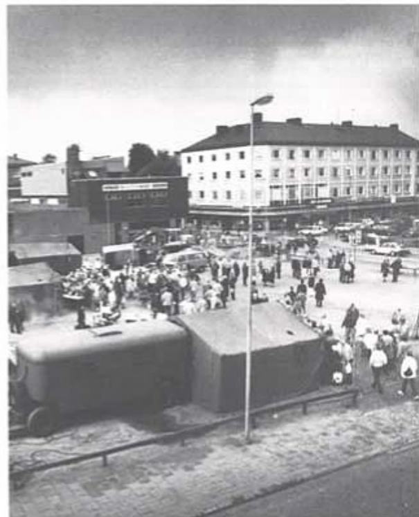
När hässleholmarna vaknade lördagen 3. oktober 1987 fann de ett grupperat fältbageri mitt i centrum, på kvarteret Ryttaren. Välljud av Brunnsexetten och dofter från fältbageriet lockade tidigt många. Klockan 1200, när ceremonien tog sin början, var hela kvarteret fyllt av flera tusen hässleholmare.

Ett tack till alla som hjälpte till att göra firandet av T 4 80 år i Hässleholm till ett så soligt minne. Deltagarna ur regementet, frivilligorganisationerna, Brunnsexetten,